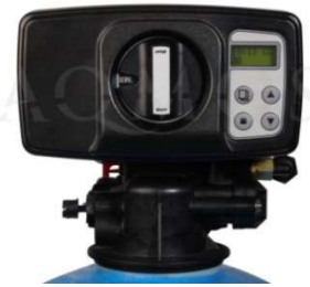
Abb. 2: Steuerventil BNT 1650

GFK- Druckflasche, gefüllt mit hochwertigem Ionenaustauscherharz, modernes Design, Kabinettgehäuse für einen Salzvorrat von max. 25 kg oder 50 kg, aufschiebbarer Deckel, mengengesteuertes Zentralsteuerventil Typ BNT 1650, integriertes Feinverschneidungsventil, Absaugeinrichtung und Verbindungsleitung zum Zentralsteuerventil, Abwasserschlauch 12 Ømm – Länge 2.000 mm.